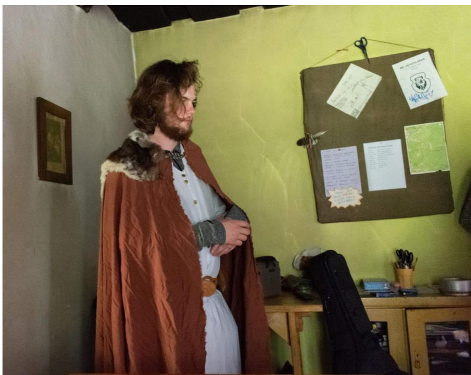
Fotky z víkendovky „Nitrianská brána“ ve Velkých Karlovicích 12. - 14. 11.