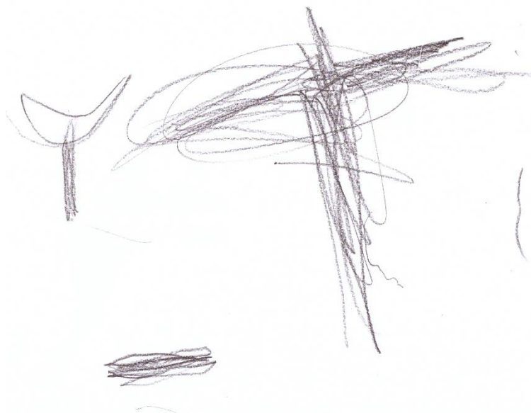
obr. Jarmilka Binderová: kalich a kříž

Ve sboru jsme ve čtvrtek prožili bohoslužbu na památku ustanovení večeře Páně, kdy se zároveň čte o Ježíšově umývání nohou. Pak jsme slavili sederovou večeři, abychom