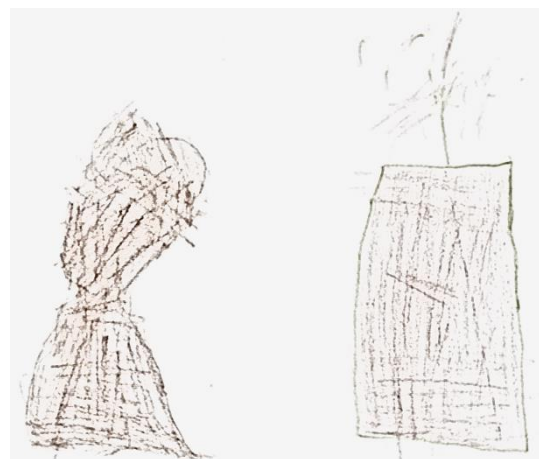
obr. Anička Plešková: kalich a svíčka

Spolu s dětmi jsme proto letos kladli kolem kříže kameny, buď mlčky, nebo se zmíenkou toho, co nás mrzí či tíží nebo co je pro nás v životě těžké. A po neděli jsme kladli kolem zlaté záře, která kříž obklopila, barevné kamínky, každý za něco, co nás těší a za co jsme vděční. Obrázky dětí z těchto chvil zde otiskujeme.